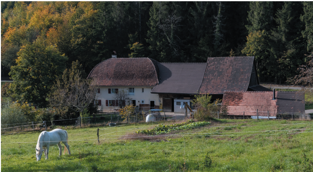
Der Bauernhof «Ränggersmatt», für viele einfach «s Schürli», an der Strasse zur Schönsmatt.

Vor 200 Jahren wurde das Bauerngut Ränggersmatt in mit seinem markanten gewölbten Dach erstellt. Grund genug die Geschichte des «Schürli» zu erkunden. Der in Arlesheim wohnende Historiker Franz Wirth nimmt uns mit auf eine spannende Zeitreise zurück, über das Mittelalter hinaus.