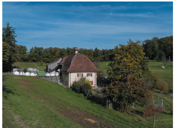
Blick auf die Südfassade der Ränggersmatt.