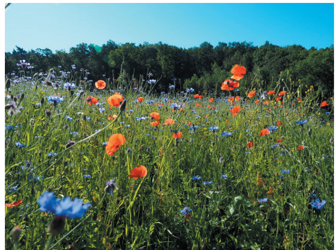
Die Artenvielfalt verzückt auch das Auge.

Da der Viehbestand aus Tierschutzgründen reduziert werden musste und die Stallungen nicht mehr zeitgemäss sind, konnten ehemalige intensiv