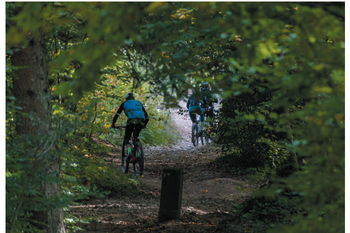
Biker fordern unterwegs auf ihrem Trail.