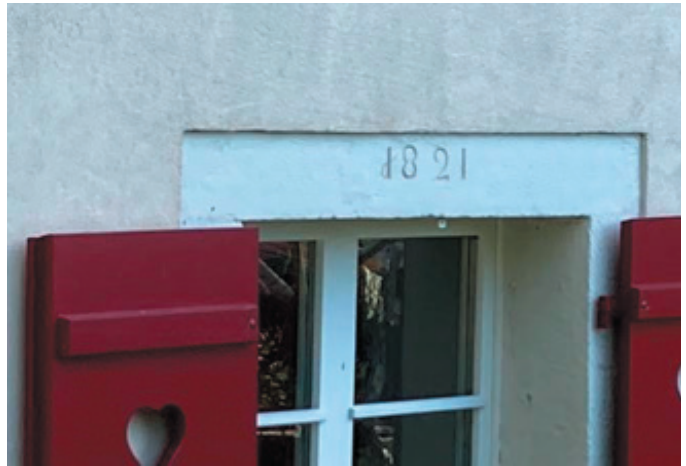
Baujahr auf Türsturz bei alter Haustüre.

Später, in Zeiten abnehmender Bevölkerung (Pestepidemien, Klimaverschlechterung) wandelte man diese Felder in Weideland um. Funde von wilden Reben im «Gstüd» nördlich des Schönmatwegs (siehe Karte) scheinen darauf hinzuweisen, dass dort im Mittelalter ein Rebberg angelegt worden ist. 5 Der Kahlschlag beschränkte sich auf einigemassen ebene Flächen. Die Steilhänge beidseits des Schönmatwegs blieben dagegen – abgesehen