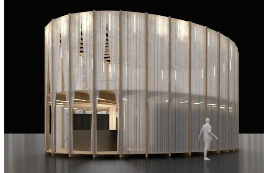
Pavillon im Swissbau Focus 2016 Tragwerk und Treppe aus Schweizer Buche Hermann Blumer / bbk-Architekten